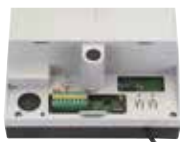
Motorsturing E1000 (ingebouwd) Zie pag. 174