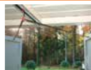
V KIT HEAVY Versterkte adapter voor buitendraaiende vleugel deur